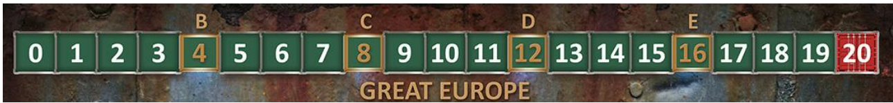
Afbeelding: contractenspoor; de letters horen bij de 5 technologiefasen.